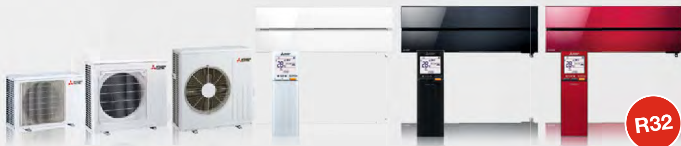
MUZ-LN25 / 35VG2