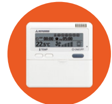
Kabel-FB RC-E5 1)