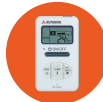
Einfache Kabel-FB RCH-E3 1)